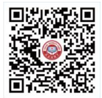
电子社保卡 支付宝小程序

目前，个人在申领第三代社保卡时，会同步完成电子社保卡的申领。持卡人实名登录社保卡服务银行 APP、电子社保卡小程序等同步申领渠道，经本人同意后就可以直接使用