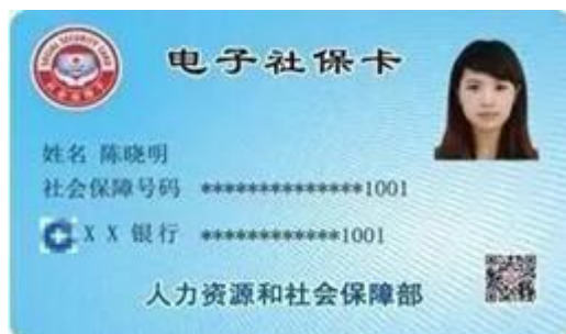
(图片：电子社保卡样图)

电子社保卡有两种表现形式，一是手机端显示的与实体卡一致的电子社保卡信息，用于人工核对并办理业务；二是手机端显示电子社保卡二维码，用于信息系统识别人员身份、缴费结算、办理业务。